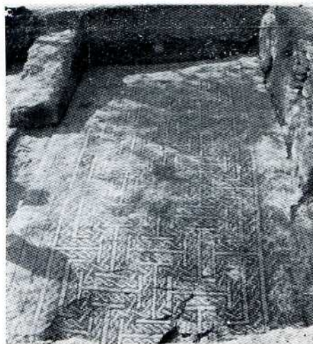
Lámina 1 — Detalle «Mosaico Calanda». Teruel

Una vez efectuada esta operación de limpieza con agua clara, puede ocurrir que el mosaico en algunas zonas esté recubierto de una capa de cal petrificada, que no permita ver las teselas o dibujos que forman; en este caso es preciso tratar estas zonas con ácido clorhídrico (sulfumán), rebajado con agua en una proporción del diez por ciento, hasta conseguir suprimir estas capas de incrustaciones, pero procurando que no se extienda a las zonas limpias, pues podría ocurrir que el ácido atacase al mismo tiempo a las teselas colindantes. Es imprescindible que cada vez que se efectúa un tratamiento con ácido se limpie con agua la zona afectada, pues de este modo nos facilitará el trabajo, al poder comprobar los efectos que ha producido y, una vez limpias estas zonas, procuraremos aclararlas repetidamente hasta conseguir la completa desaparición del ácido. Este trabajo es delicado, por el motivo de que las teselas que forman el mosaico, por regla general, son de diferente composición y, por lo tanto, el ácido ataca más a unas que a otras. Para extender el ácido sobre el mosaico, lo haremos con una brocha en una superficie, como máximo, de 50 cm.