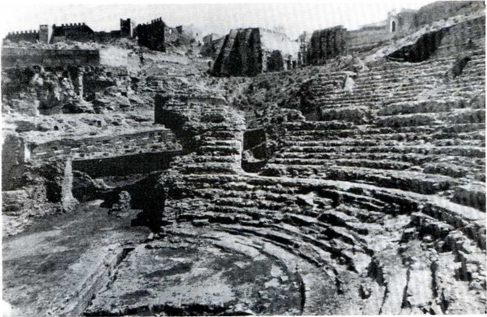
Vista parcial (lado izquierdo)