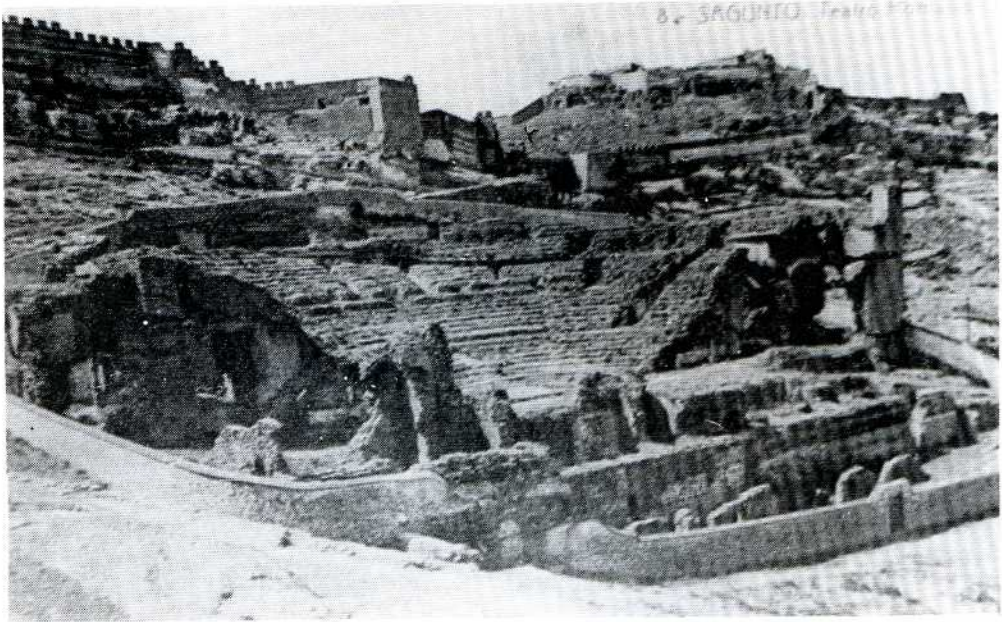
Vista general después de la destrucción de 1.811