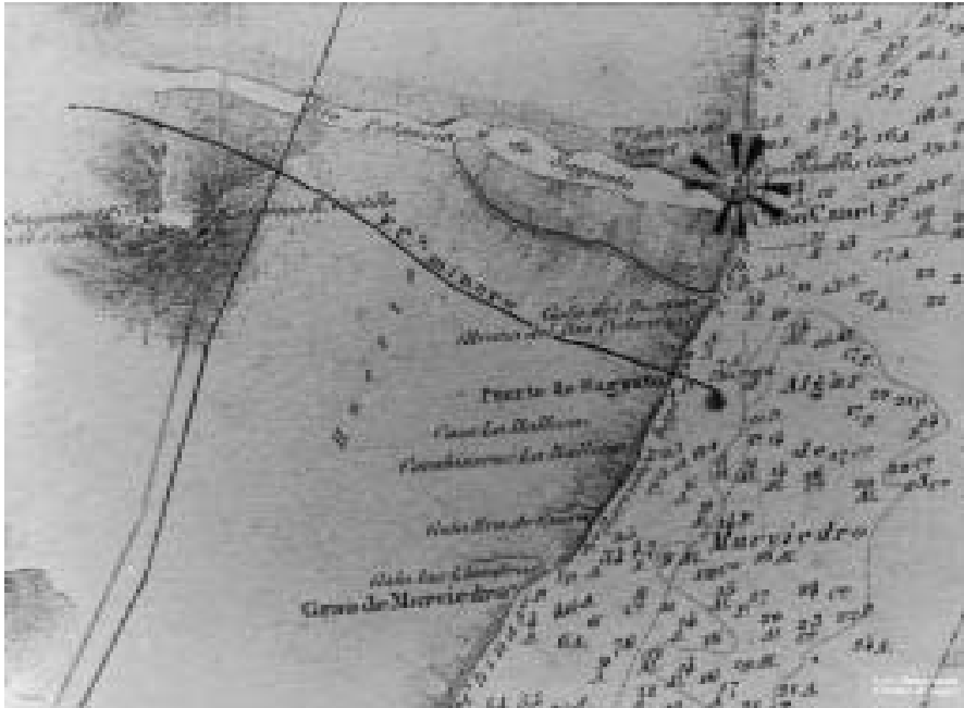
Desembocadura del riu Udiva en el segle XIX. (Mapa de l'arxiu Llueca-Jueas)

de l'altiplà peninsular i ha estat una font de vida, com tots els rius, i un camí d'accés de la costa a l'interior i, òbviament, de descens de l'interior a la costa. El riu discorre entre les serres d'Espadà i Calderona i desemboca formant un delta de dos braços: el braç del curs actual i el del reaprofitat barranc d'Almudàfer. És oportú dir una vegada més que el delta del riu a la fi del segle XIX estava format per dos braços: el més important és el que acapara el llit actual fins a la mar vorejant