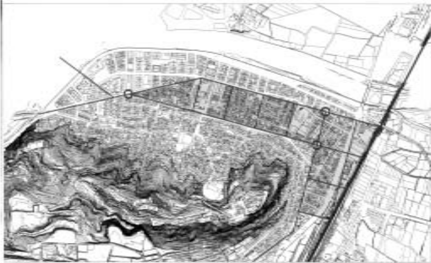
Possible expansió de la Ciutat Imperial.

tan importants i prestigioses com flamen i president dels salis.