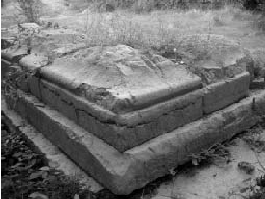
Brancatge de la porta del possible fòrum imperial.

ens diu algunes coses que recolzen la meua hipòtesi. Diu que conservava dos terços de la fàbrica romana que estava construïda amb pedres de gran tamany treballades amb maça i cisell, mamposteria i tapieria. Diu també que considera molt encertada la tradició popular que considera la construcció com una fortalesa, perquè tenia forma rectangular i acabava en merlets, segurament d'època islàmica perquè les espilleres tenien forma de mitja lluna obertes horitzontalment. La significació de la construcció i les restes que afloraven en el contigu pati anomenat Cortijo fa pensar que el lloc fou també escenari privilegiat des del segle XIII fins als XVII de la moreria. El pis de l'edifici era més d'un metre per baix del nivell actual del carrer, tenia una porta arquejada amb dintell en què els brancatges eren dues pedres de vuit peus d'alts per tres d'ample i que amb motiu d'obres que es realitzaren davant de l'anomenada Casa Romana aparegueren en el subsòl del carrer de la Raseta grandíssimes lloses de pedra. Facundo Roca i Isidre Peris, que han conegut l'edifici, ens ha confirmat alguns