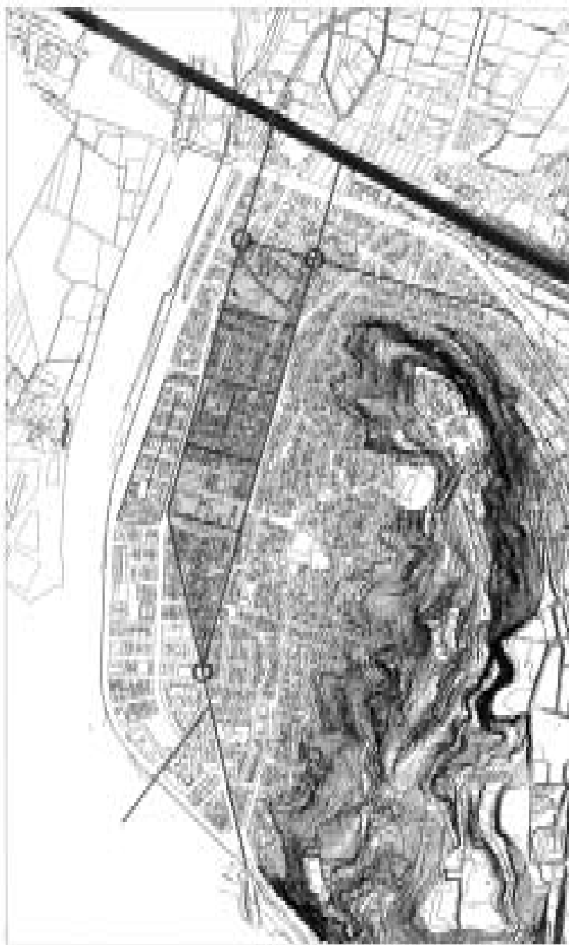
Proposta de traçat de la Ciutat Imperial.