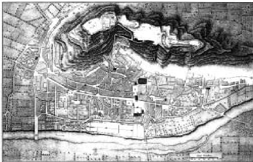
El plànol de Laborde de finals del segle XVIII ens aproxima moltíssim a l'estat de Saguntum a final del segle I dC i posteriorment amb la decadència de l'Imperi Romà.

Els límits i les estructures viàries de la ciutat construïda a la falda nord de la muntanya coincideix pràcticament amb les muralles de la madina islàmica i vila medieval i, de fet, les cimentacions dels quals mostren encara els carreus i materials antics. De fet, podem identificar els accessos a l'acròpolis i les portes, que coincideixen pràcticament amb les medievals amb les variacions que exposaré. Pel sud-est la ciutat romana abastaria el que fou després raval de Dalt i tindria les portes: 1. Camí de Lliria (Edeta) que potser a l'alçada del carrer Nàquera on hi hagué una muralla fins a l'inici de segle XX que baixava del Fòrum i a nivell del carrer de Vista Alegre encara existeix una cisterna romana 7 , 2. Porta de Ferrissa. Cap al nord (riu) s'obrien les portes que donaven a la Via Turolis al seu pas per davant de la ciutat, eixides que venen a coincidir amb els carrers actuals següents: 3. Escipions-Herois-Tres Castellet-Acròpolis; 4. Andriani-plaça dels Dolors-Vell del Castell, Acròpolis; 5. plaça Major-pujada del Castell-Acròpolis; 6. Plaça de l'Hospital de Na Marcena. Cap a l'oest s'obria la Porta de Terol en el trajecte dels carrers José Lerma i Gilet. És pertinent aclarir que les carxates del carrer de València i del Caminrel, la veu carxata