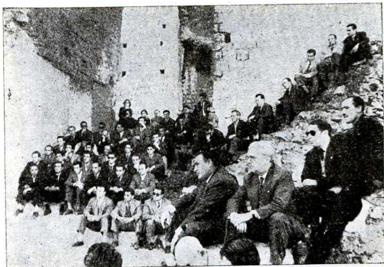
Aspecto parcial de los concurrentes al acto

Recriminó el lamentable abandono por el que han pasado las joyas arqueológicas saguntinas con citas y anotaciones que, por ser personales, valorizan más sus sabios exhortos a socios y Directivos con las nuevas obligaciones contraídas. Poniéndose a la entera disposición del nuevo Centro Arqueológico