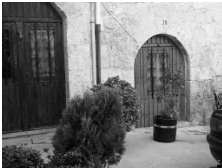
Portalada amb la mezuzà.