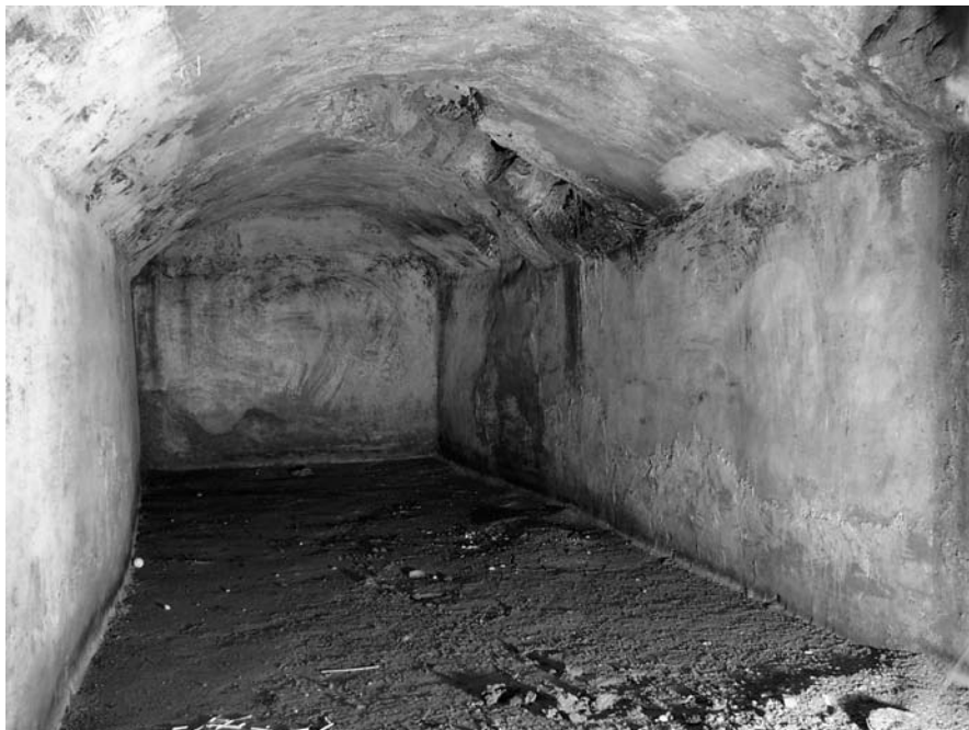
Cisterna de la Sinagoga i de les confraries als choragia del temple de Diana.