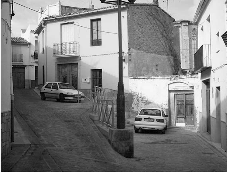
Casa que ocupa el bell mig de la plaça de la Jueria.

lo meu cors sia liurat a eclesiàstica sepoltura en la fossa e o sepoltura que stà davant lo altar major de la Lloable Confraria de la Puríssima Sanch de Nostre Senyor Déu Jesuchrist, y vull que sia fet lo meu soterrar ab general de capellans y la creu major de Santa Maria.” 18