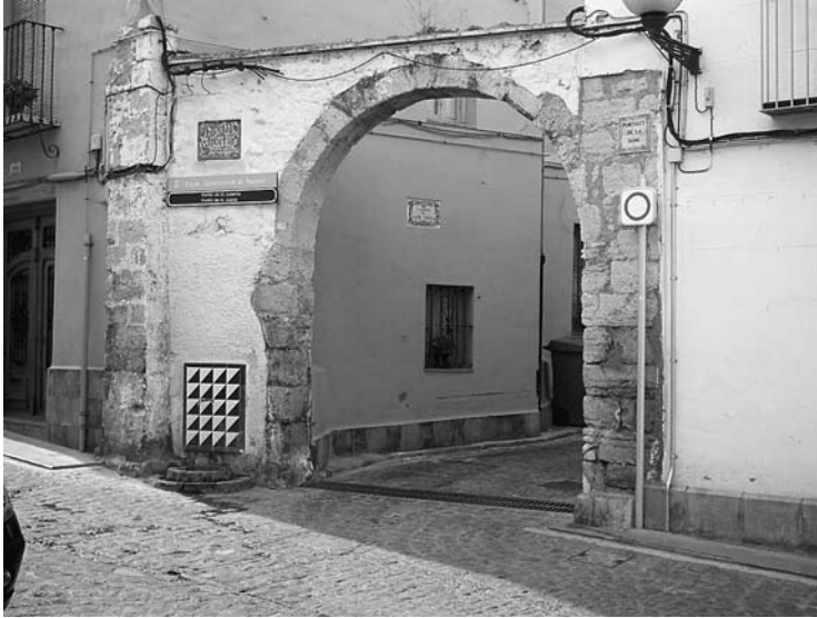
Portalet de la Jueria.

peraires puguen reunir-se les vegades que ho desitgen per a tractar assumptes propis del seu negoci i confraria, i que en la festa del Corpus Christi puguen, per votació, nomenar tres majorals, un clavari i dos veedors, de caràcter anual. 11