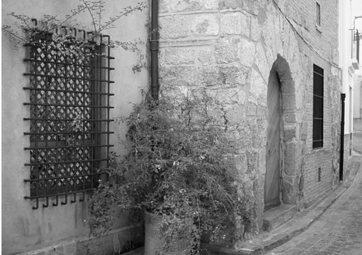
Edifici noble de la Jueria.

poques un itinerari guiat de deu edificis i espais urbans que, units al Museu Jueu que podem ubicar a la casa municipal de Sang Vella 6, suposaria una proposta única i envejable. Per a acabar, presentem breument els punts de parada que als nostre entendre s'haurien de destacar. La visita podria començar a la plaça de la Pescateria on ben possiblement els jueus gestionaren el triador (sota els arcs apuntats) i el préstec (casa que té el dintell amb el relleu d'una mà encerclada).