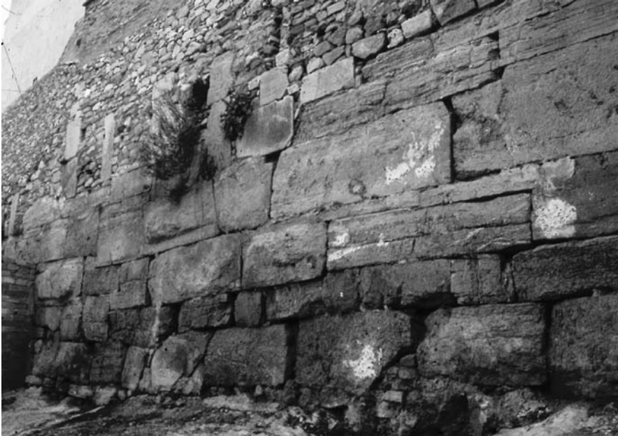
Costat nord del pòdium del temple de Diana.