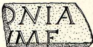
Fig. 13. —Fragmento de inscripción, en mármol blanco, cuyas dimensiones son de 0'14 m. en su parte superior, de 0'16 m. su parte inferior, de 0'09 m. el lado derecho, de 0'08 m. el lado izquierdo y 0'02 m. de grueso, este fragmento de reducidas dimensiones se compone de siete letras incisas, tres de ellas completas y las otras cuatro incompletas, son de la capital cuadrada monumental y su interpunción es triangular, este pequeño fragmento lo halló el socio Facundo Roca en un solar y sirvió de piso junto a otras piezas similares, las letras permanecían boca abajo.