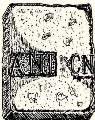
Fig. 17. —Fragmento de inscripción en piedra (c. a. de c. l.) de 0'64 m. de altura, 0'47 m. ancho parte superior, 0'49 m. ancho parte inferior y 0'15 m. de grueso. Consta esta inscripción de cinco letras de 0'12 m. de altura, A N I, CN, las tres primeras letras se encuentran insertas en una cartela, siendo ésta la terminación de una palabra o título fraccionado, las otras dos siguientes en principio de expresión Gneo.