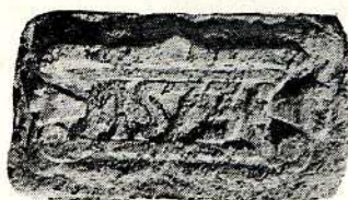
Fig. 16. —Pieza completa de piedra (c. a. de c. l.), de 0'49 m. de largo, 0'28 m. de altura y 0'22 m. de grueso, su texto es el año 1573 grabado en relieve, inserto en una decorativa cartela también en relieve, magníficamente tallada, ésta ocupaba un espacio a 1'50 m. de altura, y en la parte S. de la misma torre de la Casa Criado-Becerril.

La mencionada pieza fue recuperada de la Casa Criado-Becerril, la cual permanecía empotrada en el muro de la torre lado E.