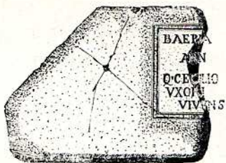
Fig. 10. —Fragmento de inscripción funeraria romana, piedra (c. a. de c. l.), sus dimensiones son de 0'85 m. de largo, 0'65 m. de altura por 0'18 m. de grueso, componen este fragmento quince letras incisas, de las cuales doce se encuentran enteras y el resto incompletas, con una altura de 3'5 cm., insertas en una cartela de 40 cm. de altura, su forma es de capital cuadrada monumental, de interpunción triangular, y su texto es el siguiente:

B A E B I a Annorum Q. C E C i l i o V X O r i V I V e n s