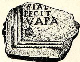
Fig. 12. —Fragmento de inscripción funeraria romana, piedra (c. a. de c. I.), sus dimensiones son de 0'43 m. de largo, 0'40 m. de altura por 0'20 m. de grueso, figuran insertas en cartela trece letras incisas, de 4 cm. de altura en las dos primeras líneas, y de 6 cm. de altura en la de la tercera línea, son de capital cuadrada y de interpunción triangular, su texto es el siguiente: