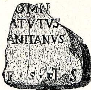
Fig. 9. —Fragmento de inscripción funeraria romana, piedra (c. a. de c. l.), sus dimensiones son de 0'36 m. de largo, por 0'38 m. de altura y de 0'20 m. de grueso, figuran en este fragmento veintidós letras incisas, de las cuales diecinueve permanecen enteras y el resto incompletas, con una altura de 5 cm. las de la primera línea y de 4' cm. las de la segunda y tercera línea, son de capital cuadrada y de interpunción triangular, su texto existente es el siguiente: