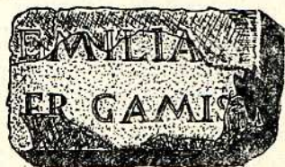
Fig. 7.—Fragmento de inscripción funeraria romana, piedra (c. a. de c. l.), (1), sus dimensiones son de 0'46 m. de largo por 0'29 m. de altura y grueso, la altura de las letras de la primera línea es de 6 cm., y la altura de las letras de la segunda línea es de 5 cm., el texto del fragmento consta de doce letras incisas, de las cuales existen cuatro enteras y ocho incompletas, su forma corresponde a la capital cuadrada, de interpunción triangular, su transcripción es como sigue: