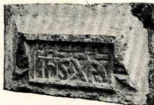
Fig. 15. —Esta pieza muy característica de la época medieval, de piedra (c. a. de c. l.), con dos monogramas, la pieza en cuestión mide 0'50 m. de largo, 0'28 m. de altura por 0'23 m. de grueso, las letras tienen una altura de 63 mm., insertas en relieve en una cartela muy decorativa, por estar completa y bien conservada se lee claramente I H S = Jesucristo en latín, y X P S = Jesucristo en griego, ambos monogramas permanecen unidos por el signo de abreviatura.

La mencionada pieza fue recuperada de la Casa Criado-Becerril, la cual permanecía empotrada en el muro de la torre lado E.