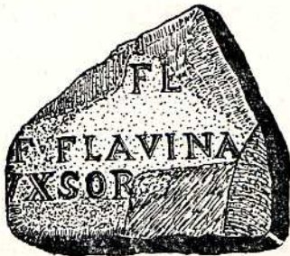
Fig. 11. —Fragmento de inscripción funeraria romana, piedra (c. a. de c. l.), sus dimensiones son de 0'47 m. de largo, 0'46 m. de altura por 0'12 m. de grueso, se le aprecian quince letras incisas, de las cuales trece permanecen enteras y el resto incompletas, tienen 4'5 cm. de altura, capital cuadrada y de interpunción triangular, y con el siguiente texto:

B A E B I a Annorum Q. C E C i l i o V X O r i V I V e n s