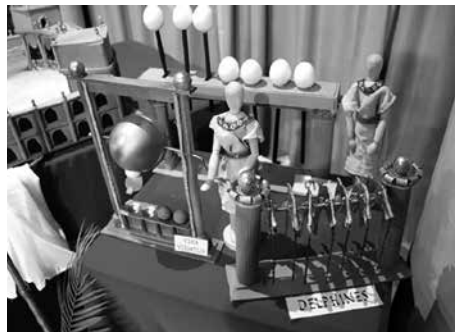
Contadores y urna versatilis