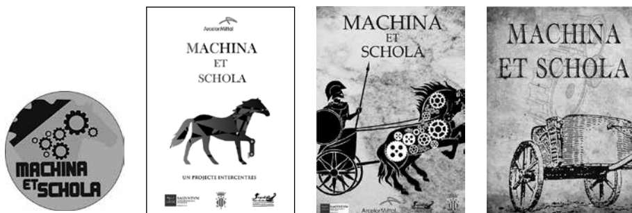
Concurso de paneles y chapas del IES Clot del Moro

El IES Clot del Moro realizaron un concurso de carteles con el logo del proyecto e hicieron una exposición de los finalistas, así como unas chapas del proyecto con el diseño elegido para todos los participantes en el mismo.