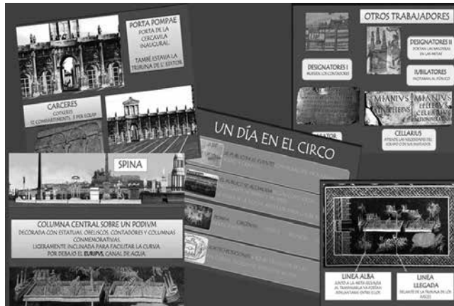
Paneles informativos sobre el circo romano

Búsqueda de iconografía con representaciones de circos, carreras, aurigas, etc que sirvieron para la redacción de paneles informativos sobre el tema seleccionado. Los paneles explican muchos aspectos de esta actividad tan admirada por los romanos: el edificio, sus trabajadores, su simbolismo, desarrollo de una carrera, las estrategias del equipo, la magia, etc.