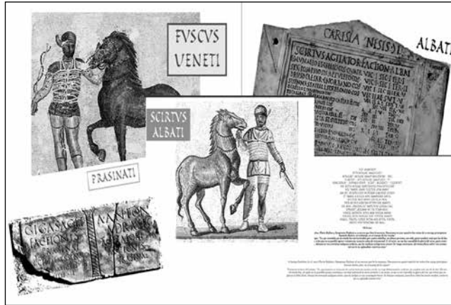
Inscripciones funerarias de aurigas romanos

No quisiéramos finalizar esta colaboración sin celebrar la unión tan productiva entre la iniciativa privada y el interés público del que este proyecto es un excelente ejemplo de trabajo en equipo y de creación de material didáctico de un variado espectro. Todo el trabajo hecho sobre el circo romano seguirá vivo mucho tiempo pues el producto final de cada uno de los participantes de esta primera fase del proyecto estará expuesto permanentemente en el nuevo centro de interpretación del mundo clásico que el Ayuntamiento tiene pensado abrir en un tiempo no muy lejano, Civitas Amabilis .