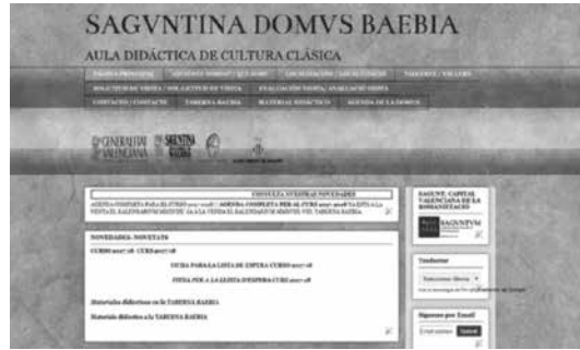
Web Sagvntina Domvs Baebia http://domusbaebia.blogspot.com.es/

Las más de 70 inscripciones halladas sobre esta familia son el hilo conductor para trabajar diferentes aspectos de la vida cotidiana, religiosa, política y social de la época romana.