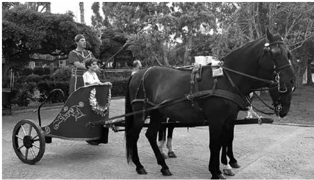
Biga construida por los alumnos del IES Eduardo Merello

Tras varias reuniones de todo el equipo participante, cada centro se dedicó a trabajar en un aspecto específico a lo largo del curso lectivo hasta presentar el producto final en el mes de junio.