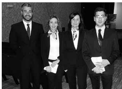
Alumnos IES Jorge Juan

El IES Jorge Juan por su parte se encargó de la organización de la presentación del proyecto que se hizo en marzo en el centro cívico Mario Monreal y de la clausura del curso 2016-17 que se realizó en el centro cívico del Port de Sagunt y de su difusión en las redes sociales.