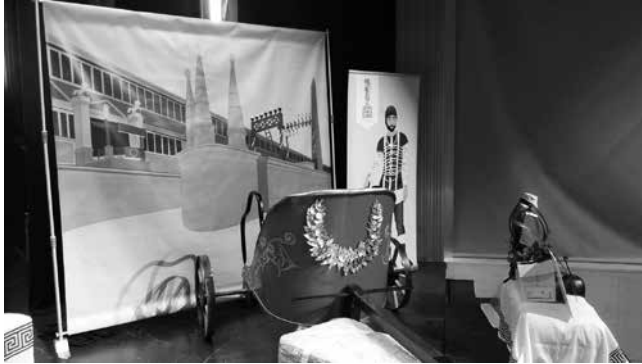
Fondo fotográfico diseñado por tándem comunicación

viera para poder colocar la biga para que pareciera que estaba en la misma arena del edificio y para hacerse fotos delante de él. En segundo lugar, con un cometido más didáctico, aprovechar para poder explicar cada una de las partes que caracterizan a la edificación, como pueden ser la spina central, la cauea , las carceres , los contadores, las metae , etc.