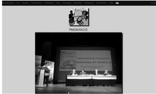
Web Machina et Schola. http://www.machinaetschola.com/ Montada por el alumnado del IES Camp de Morvedre