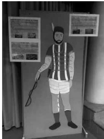
Panel imantado dibujado y creado por el IES Jaume I

El IES Jaume I que trabajaron en la construcción de un auriga a tamaño natural en un panel imantado para que los alumnos puedan ponerle los elementos necesarios de su equipo, la túnica, el casco, la fusta,..