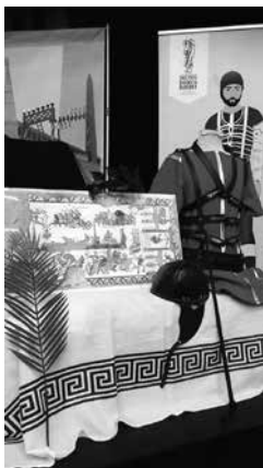
Réplica equipo auriga romano

Un equipo de auriga para poder vestir a un maniquí o al alumnado, con su casco, su fusta, su lorica, sus protectores, sus botas, su pugio y una cosa importante, coser cuatro túnicas que representan a los cuatro equipos que corrían en un circo romano: rojo, azul, verde y blanco con la finalidad de poder vivir en primera persona cómo se sentiría un auriga ante una carrera.