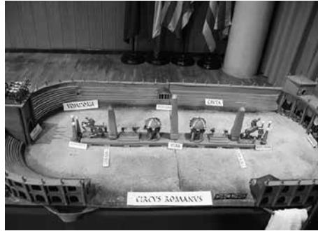
Maqueta circo romano con sus partes

Una gran maqueta de circo con todas sus partes desmontables para poder ir construyendo el circo con el alumnado mientras se van explicando su función y características.