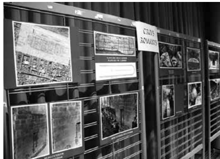
Fotos antiguas del circo romano de Sagunto