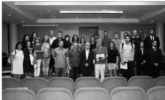
Participantes en el proyecto Machina et Schola

Como se puede ver son muchas las actividades realizadas en la Domus Baebia que sirven para promover la cultura clásica, como MACHINA ET SCHOLA , impulsado por la empresa ArcelorMittal.