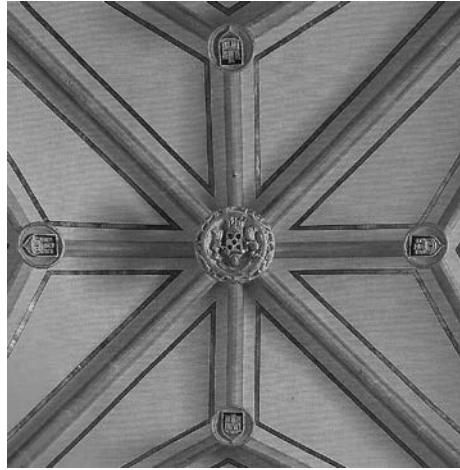
Fig. 6. Escuts dels Pròxida a les claus de la capçalera de l'església del monestir del Corpus Christi de Llutxent. Font: BÉRCHEZ, Joaquín, GÓMEZ-FERRER, Mercedes i ZARAGOZÁ, Arturo, Llutxent, Monestir i Basílica dels Corporals, València, Diputació de València i Ajuntament de Llutxent, 2009.

Les patrocinadores de la família també van dirigir les obres de construcció i decoració de l'església del cenobi. Des que els Pròxida assumiren les obres del monestir, diferents generacions van ser les què ho van portar endavant: primer en Olf de Pròxida, qui lliurà els terrenys a l'orde dels dominics en 1422; després Joan de Pròxida i la seua dona Violant, i sobretot el fill d'aquests, en Nicolau de Pròxida, al llarg del segle XV. 26