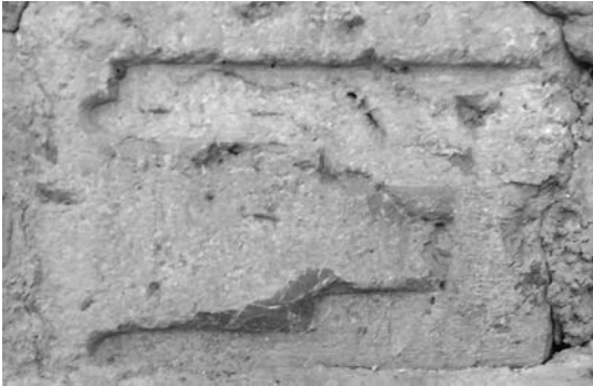
Fig.1. Pedra calcària localitzada a Quart amb el baix-relleu d'una torre sobre ones de mar.