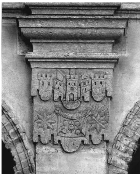
Fig. 7. Capítell del claustre del monestir del Corpus Christi de Llutxent amb escut dels Pròxida.

recordava molt als atributs típics militars medievals. Les torres evocaven els castells nobiliaris i el passat militar d'on provenien els cavallers. El castell, i la seua variant, la torre, era, de fet, un dels elements més representats en heràldica. 28 Segons Valero de Bernabé, la torre sol aparèixer sobre ones marines en record de la fosa que solia envoltar els antics castells, tipologia que l'autor anomena torre sobre aguas . La torre es conforma amb un sol cos amb merlets perforat per una porta i dues finestres, sovint essent de plata o or, i no sempre presentava la mateixa forma. Aquest autor ha comptabilitzat un total de vint-i-quatre variants del mateix tema. 29