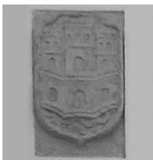
Fig. 5. Escut dels Pròxida a la capella de la Mare de Déu de Gràcia del cenobi del Corpus Christi de Llutxent.

Gràcies a la representació de l'escut dels Pròxida conservada en altres espais, que si que han mantingut els colors, sabem que era de gules (roig) amb un castell de plata (gris) posat sobre ones d'aigua de plata i azur (blau) i envoltat per una bordura. 23 Aquests exemples els podem trobar en el Monestir del Corpus Christi de Llutxent que va ser patrocinat pels Pròxida.