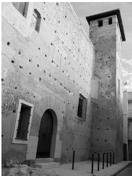
Fig. 8. Façana principal del palau de Llutxent.

Un dels elements que evocava la presència dels Pròxida a Quart era, sense dubte, el palau senyorial que tenien al poble. L'escut i la casa en si mateixa era la seua senya d'identitat i la seua manera de fer-se presents. 32 Malauradament, la fragmentació i compartimentació de l'edifici en diferents èpoques fins a la seua completa desaparició, no ens deixa pista alguna de com pogués ser. Sabem que se situava al bell-mig del poble, en la plaça de Sant Miquel i just enfront de l'església amb el mateix nom (actualment la casa de la Cultura). Sols es deixa entre veure un portal de grans dimensions, d'època moderna o contemporània, i una cantonera feta amb grans blocs de pedra.