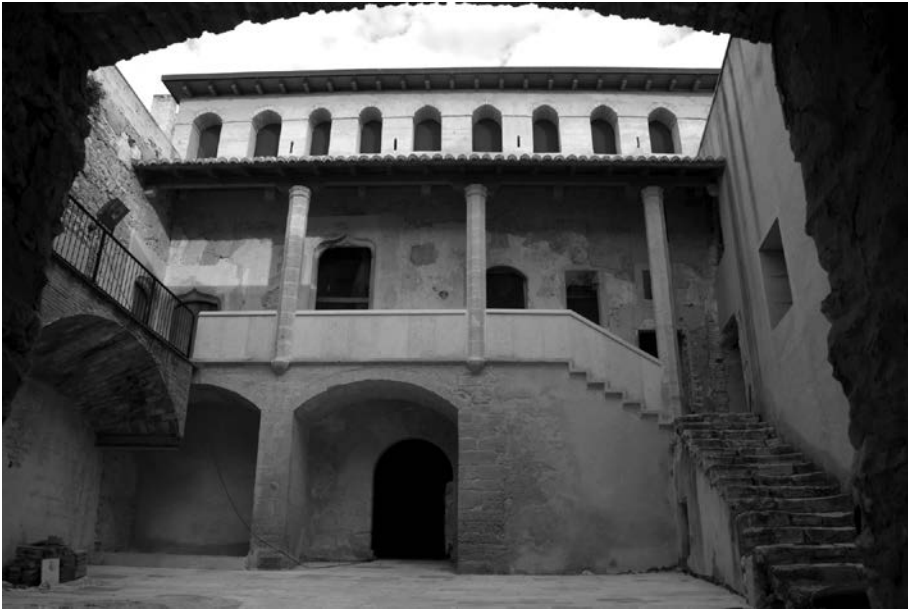
Fig. 9. Interior del pati del palau de Llutxent.