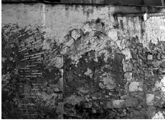
Fig. 2. Fotografia de les restes localitzades a Quart on estava l'antic palau del poble.