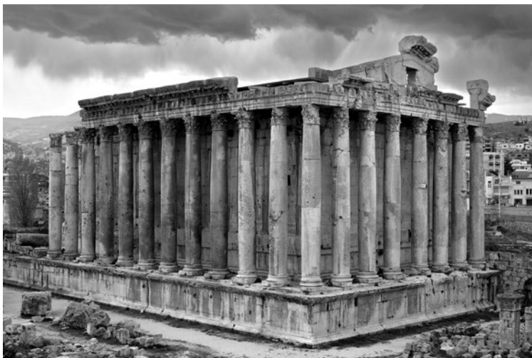
Baalbek (Líbano) Templo de Baco visitado por el Centro Arqueológico Saguntino en su salida XXXII en abril 2023.