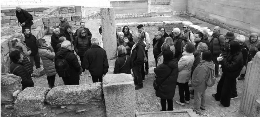
Lliria: Termas romanas de Edera.

El Ayuntamiento está tomando medidas administrativas y jurídicas para tratar de revertir las obras realizadas y que se adecuen a las necesidades para las que fueron adjudicadas, tenemos al respecto pocas esperanzas.