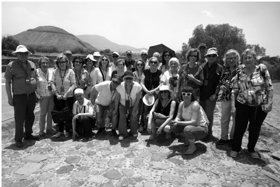
México: Yacimiento maya de Chichen Itza.

Las relaciones con las Asociaciones Culturales Saguntinas han sido fraternales.