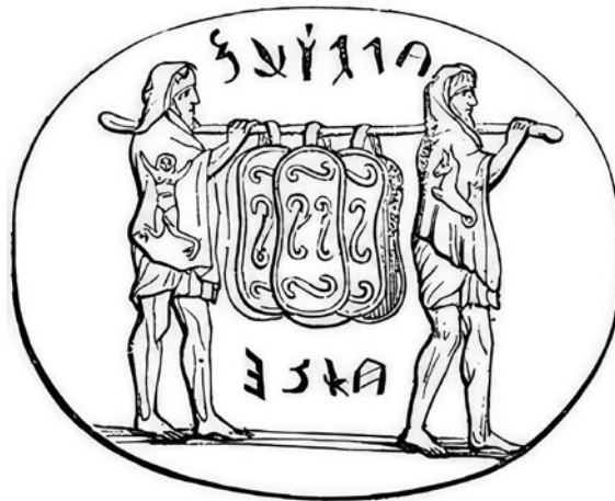
Procesión de los Ancili.

Mientras permanecía en procesión, eran custodiados por tres profesionales: “ El Magister ” (maestro), “ El Praesul ” (instructor de danza que los había entrenado) y un “ cantor solista o Vates ”. Al acercarse a un lugar divinizado, interrumpían la procesión y procedieron a bailar y golpear con sus dagas “ Los Ancilios ”, cantando en Honor a los dioses armados como Ares (Luciano, De Saltatione 20.1).